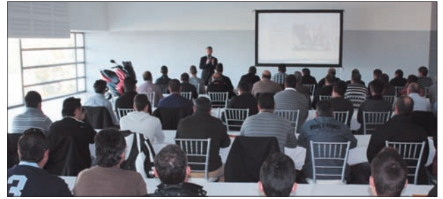
CALIDAD. Jornada de AVREMOTO.

Esta comisión tendrá un funcionamiento similar a la que se encarga de regular las plazas para personas de movilidad reducida, que se reúnen con periodicidad bimensual.