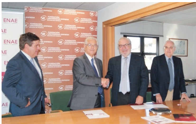
CORDIALIDAD. Máximos representantes de FREMM y FUERM en la firma.

La formación es la protagonista del convenio de colaboración que ha suscrito la Federación Regional de Empresarios del Metal de Murcia, FREMM, con la Fundación Universidad Empresa, FUERM.