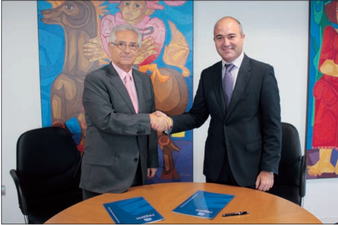
ACUERDO. Firman Redyser y FREMM.