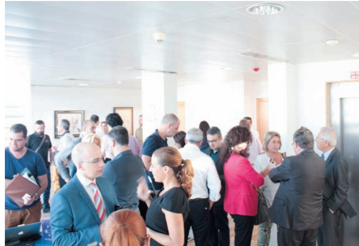
ÉXITO. Las empresas participantes, muy satisfechas con el proyecto.

El "II Desayuno del Metal" atrajo a una treintena de empresas vinculadas a la FREMM, que tuvieron oportunidad de conocer las di-